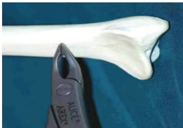
Beispiele am Kunstknochen mit K-Drähten von nur 1-2 mm Höhe über dem Knochenansatz