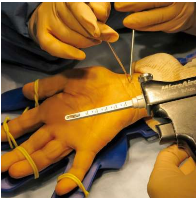
Dr. Fontes, Paris/Frankreich: Chirobloc®3 & Endoscopic CTR